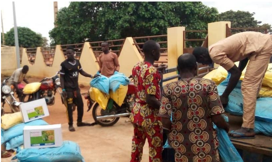
Distribution des intrants aux producteurs