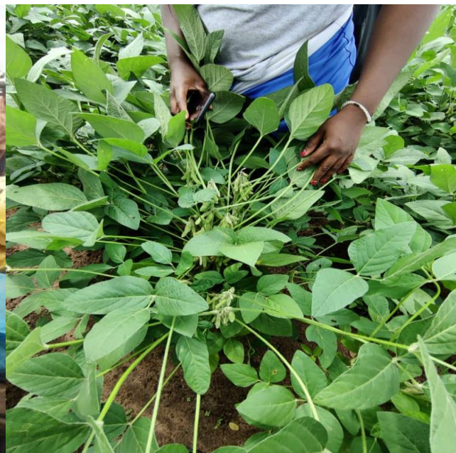
Suivi de l'évolution des exploitations