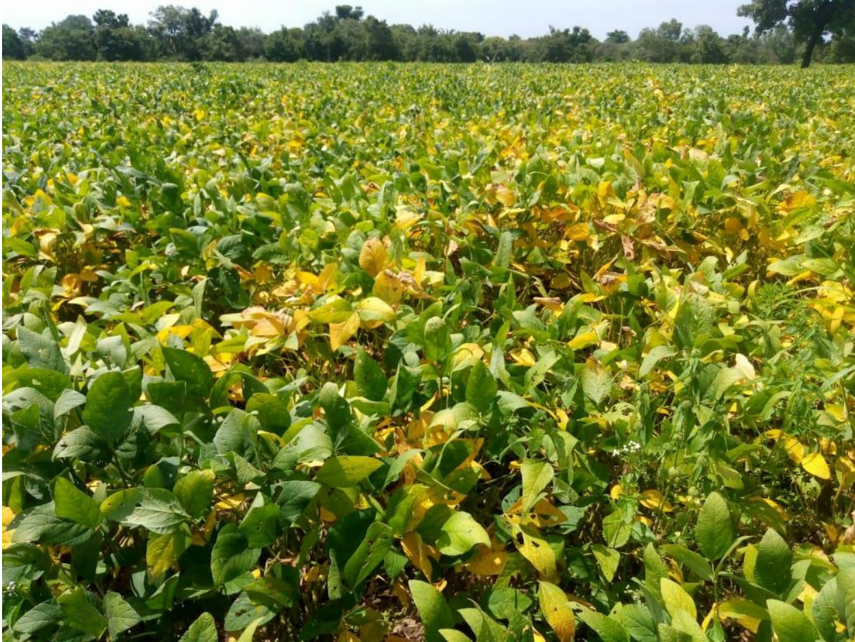
Champ de Soja prêt pour la récolte